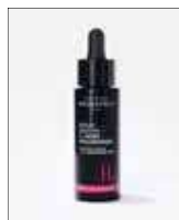
Sérum Booster à l'A.H 30 ml

Azione: idratante riempitivo e rimpolpante Tutti i tipi di pelle