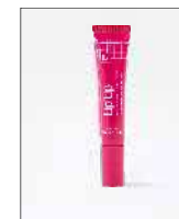
Lip'Up 8 ml

Azione: idratante riempitivo e rimpolpante Tutti i tipi di pelle