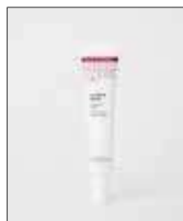
La Crème Repulp 40 ml

Azione: rimpolpante, levigante e idratante