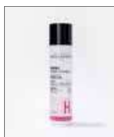
Brume Hydro-Tonique 100 ml

Azione: booster d'idratazione e rimpolpante Tutti i tipi di pelle ad eccezione delle pelli grasse