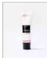
Le Masque Repulp 50 ml

Azione: rassodante e rimpolpante Tutti i tipi di pelle ad eccezione delle pelli grasse