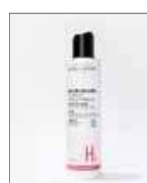
Eau Micellaire à l'A.H 200 ml

Azione: levigante, preserva e aumenta l'idratazione Tutti i tipi di pelle