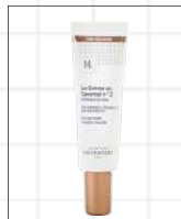
La Crème au Caramel n°1 - 30 ml

Azioni : effetto «buona salute» e incarnato setoso Tutti i tipi di pelle – Tinta chiara