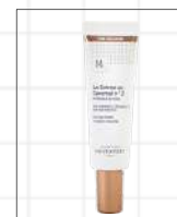
La Crème au Caramel n°2 – 30 ml

Azioni : effetto «buona salute» e incarnato setoso Tutti i tipi di pelle – Tinta chiara